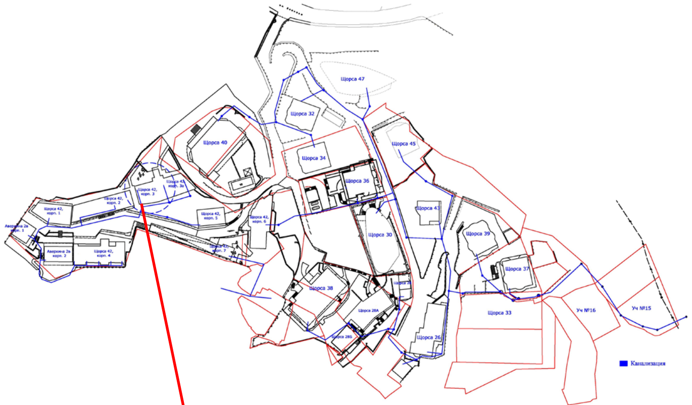
Рисунок № 3